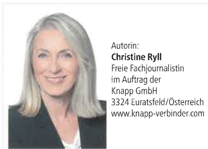
Autorin: Christine Ryll Freie Fachjournalistin im Auftrag der Knapp GmbH 3324 Euratsfeld/Österreich www.knapp-verbinder.com

Hierfür besteht der Verbinder aus zwei identischen, runden Edelstahl-Stanzprägeteilen mit Hakenlaschen, die am Rand je drei kleine Spitzen aufweisen. Diese