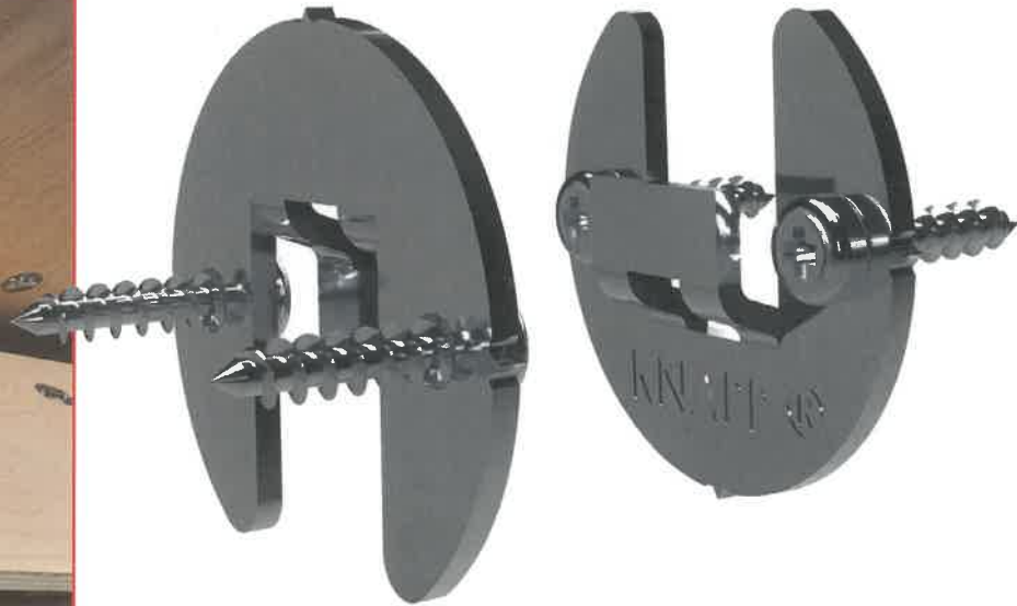
»Duo 30 Edelstahl A5« für den Außenbereich verbindet Fassaden, Verkleidungen, Möbel und Bauelemente schnell und sicher.

Kinderleicht zu verbinden und stark korrosionsbeständig: Ein neuer Verbinder aus Edelstahl von Knapp verbindet Blenden, Abdeckungen, Profilbretter, Leisten, Paneele und Verkleidungen im Innen- und Außenbereich schnell und sicher. Dabei hält er auch extremen Witterungen und Salzwasser stand. Mit diesen Eigenschaften bietet sich das für alle Hölzer, Holzwerkstoffe und Kunststoffe geeignete System insbesondere für den Yacht-, Boots- und Schiffsbau an.