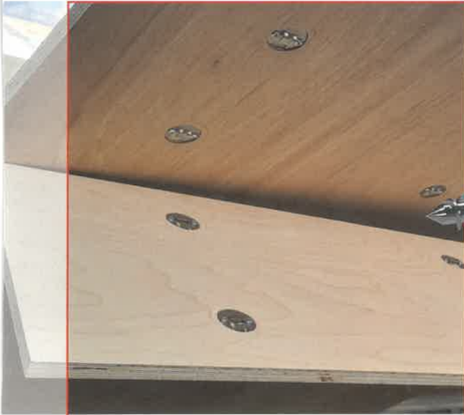
Der neue Eihängeverbinder hält auch Salzwasserumgebungen stand.