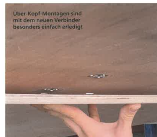
Über-Kopf-Montagen sind mit dem neuen Verbinder besonders einfach erledigt

Die Befestigung erfolgt mit Senkkopf- oder PH-Schrauben oder Verklebung. Als Zubehör bietet Knapp einen HM-Bohrer 30 Millimeter mit Tiefenanschlag und eine dazu passende Bohrschablone an.