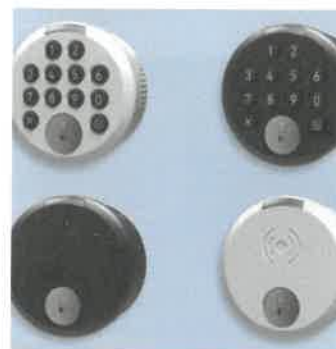
/ Die Drehknopfschlösser „Mifare“ und „Giro TA“ als RFID- und Tastaturvariante.

optische wie akustische Signale. In beiden Versionen eignet sich das „Giro“ für rechte und linke Türen. Mit der 16 x 19 mm-Lochung lässt es sich komfortabel in Stahlmöbeln und mit einem Befestigungsadapter auch in Holz oder HPL verarbeiten. (cg)