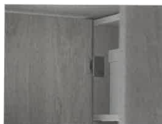
/ Das Scharnier Conecta bleibt immer unmerklich und fast unsichtbar.

anpassbaren Abdeckkappen, die sowohl für die Tür als auch für die Seite des Möbels erhältlich sind, kombiniert mit der hohen Verarbeitungsqualität, eignet sich das Scharnier Conecta für Anwendungen mit außergewöhnlicher Eleganz und Funktionalität. (cg)