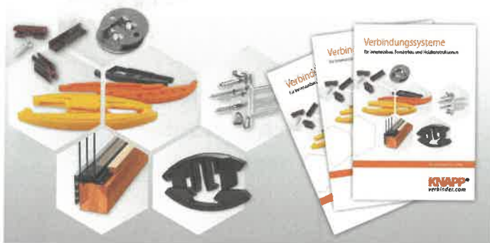
/ Neben den Produkten werden auch die Anschlussmöglichkeiten der jeweiligen Verbindersysteme an unterschiedliche Materialien vorgestellt.

In der neuen Broschüre „Verbindungssysteme Innenausbau, Fensterbau, Holzkonstruktion“ stellt Verbinderspezialist Knapp sein gesamtes Angebot vor. Gezeigt werden Verbindungssysteme für Möbel- und Innenausbau, Treppen- und Fensterbau sowie für Holz-Glas-Fassaden und Holzkonstruktionen. Alle Produkte werden anschaulich präsentiert und die Produktmerkmale, -vari-