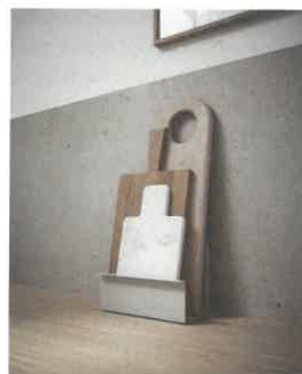
/ Piuro gibt losen Gegenständen einen eleganten Rahmen.

lebig und recyclebar. Für den sauberen Abschluss sind Silikonmatten oder -wannen eingelegt. (cg)