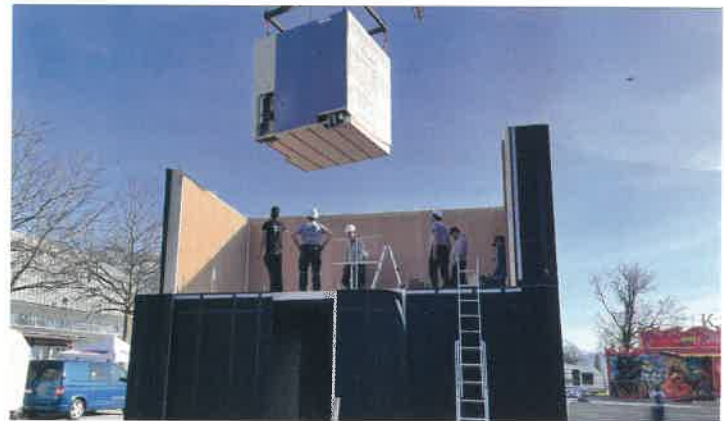
KNAPP GMBH/WOODROCKS GMBH