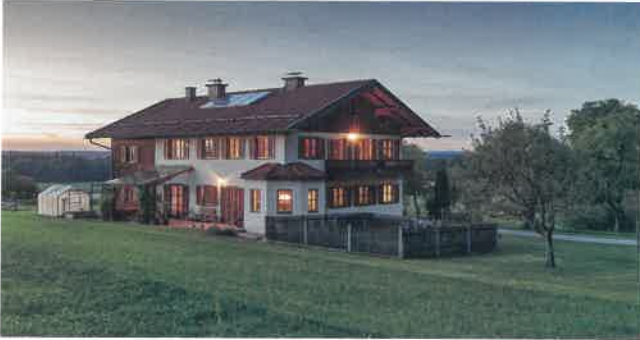
HUBER & SOHN

Huber & Sohn bieten Fensterelemente mit hohen Wärme- und Schalldämmwerten, modernen Optiken und großen Glasflächen an. Zum Sortiment gehören unter anderem eine Hebeschiebetür, falt-Schiebetür, Parallel-Abstell-Schiebetür und Fensterelemente in Holz- und Holz-Alu- sowie Kunststoff-Ausführung. Besonderes Augenmerk legt das Familienunternehmen auf die Anforderungen im barrierefreien Bauen. Die sog. „0-Schwellen“ für Fenstertüren sind mittlerweile fester Programmbestandteil. Für den Fenstertausch in denkmalgeschützten Gebäuden hat das Unternehmen das Holz-Fenster-System 78/92 speziell für den Denkmalschutz entwickelt. Und die neue Generation der Holzoberfläche „woodec“ bietet einen authentischen Holz-Look und eine angenehme Haptik.